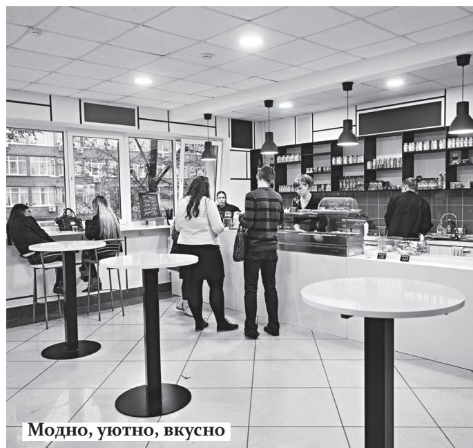
Модно, уютно, вкусно

В корпусе Е открылось очень уютное и атмосферное местечко – Student's cafe.