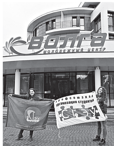
Участники слета получили опыт общения на высоком уровне.

Делегация Самарской области собрала много наград: «Лучший строительный отряд», «Лучший боец строительного отряда», 1 место в конкурсе «ПФО объединяйтесь», 1 место по результатам акции «День ударного труда», а также 2 наградами удостоено Самарское региональное отделение РСО.