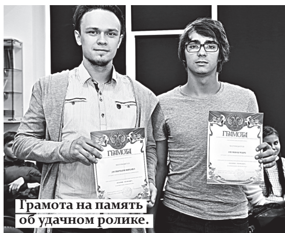
Грамота на память об удачном ролике.

многогранно понимают современные студенты понятие «Родина», а также значение изучения такой увлекательной науки, как история.