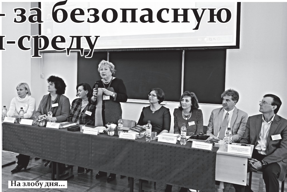
На злобу дня...

В Самарском государственном экономическом университете состоялась Международная научно-практическая конференция студентов, аспирантов и молодых ученых «Социальное поведение молодежи в Интернете: новые тренды в эпоху глобализации».