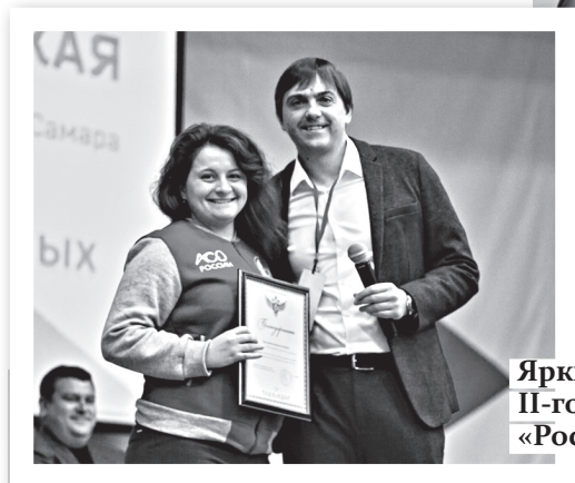
Яркие моменты II-го Всероссийского форума «Россия студенческая»