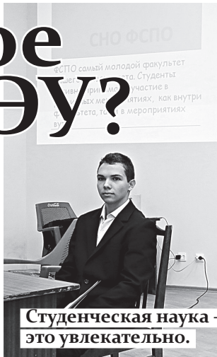
Студенческая наука – это увлекательно.

Клуб Экономического кино и литературы – команда клуба зани-