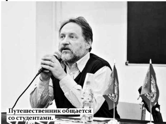
Путешественник общается со студентами.

В СГЭУ под эгидой Самарского регионального отделения Русского географического общества состоялось открытие персональной фотовыставки «Лица Чукотки».