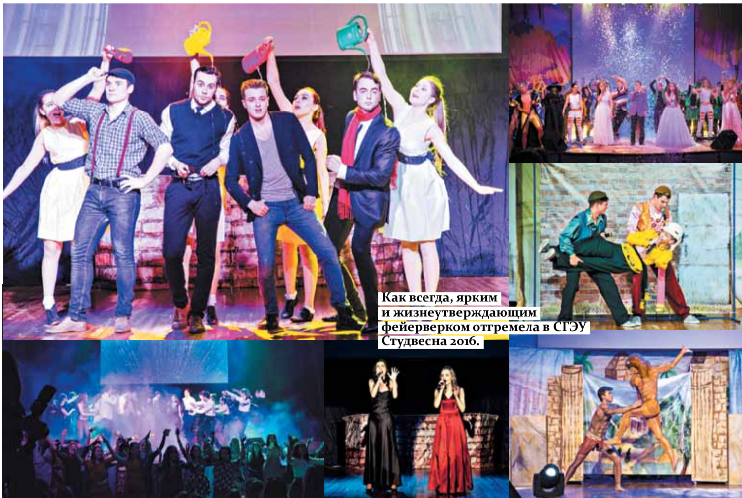
Как всегда, ярким и жизнеутверждающим фейерверком отгремела в СГЭУ Студвесна 2016.