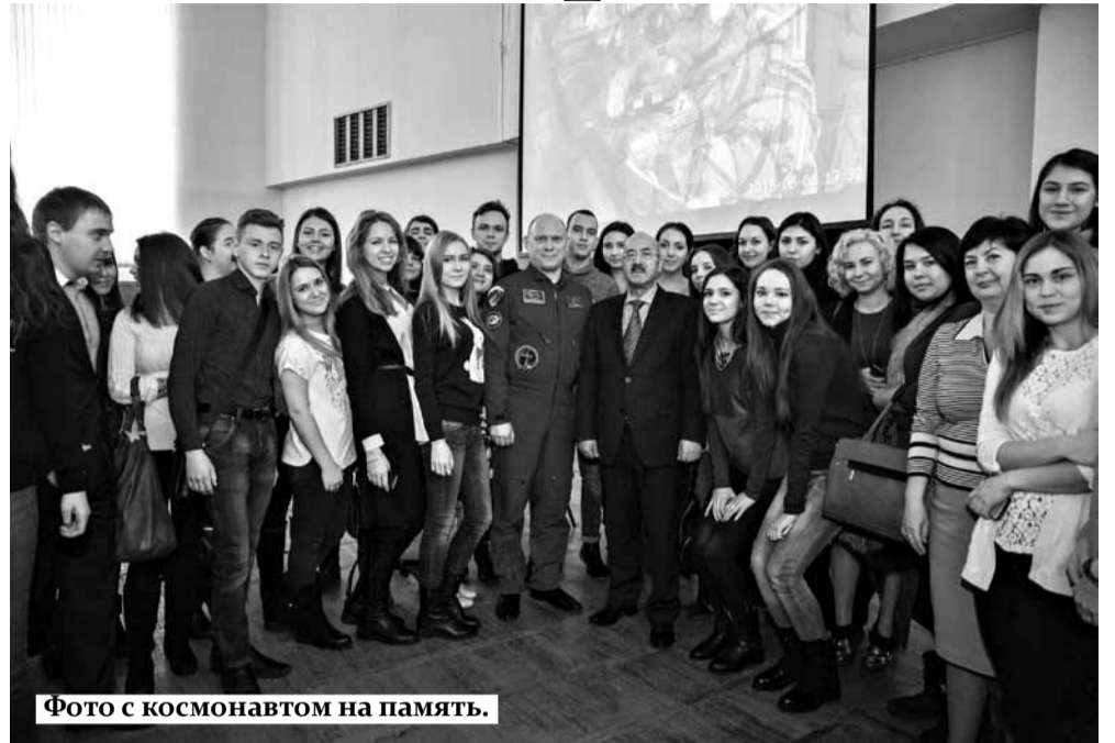
Фото с космонавтом на память.

Главная цель посещения космонавтом-испытателем российских учебных заведений, в том числе и высших, за-