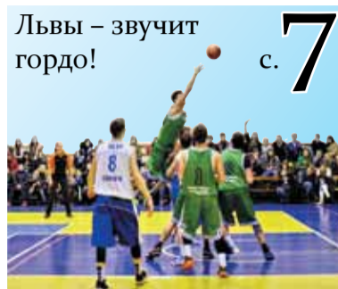
Львы – звучит гордо! с. 7