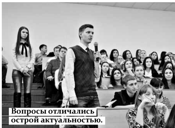
Вопросы отличались острой актуальностью.

Творческую жизнь, бытовые вопросы, в том числе сферу общепита, и многое другое студенчество активно обсуждало с ректором СГЭУ. Подробности вы можете узнать по ссылке: https://vk.com/profkom_sseu .