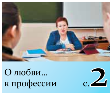
О любви... к профессии с. 2