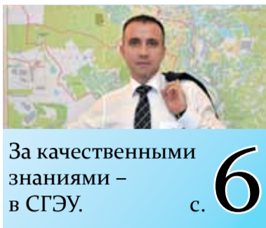
За качественными знаниями – в СГЭУ. с. 6