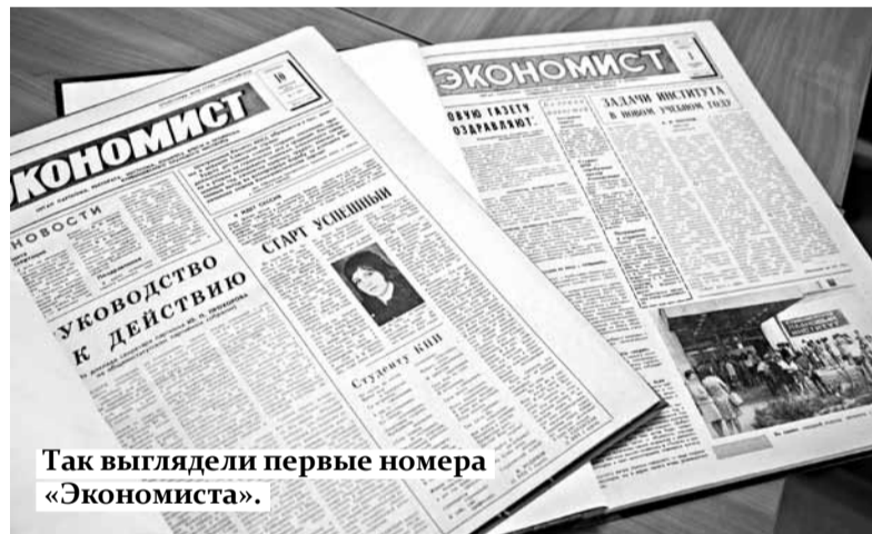
Так выглядели первые номера «Экономиста».

– Не забудем, что все время моей работы в институте прошло в годы застоя. И я не могу утверждать, что за это время молодежь кардинально менялась. Молодые люди жили тогда по законам, установленным курсом коммунистической партии – сдавали Ленинский зачет, учили историю партии и пр. Бунтарский дух, присущий молодежи, самовыражение они