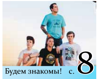
Будем знакомы! с. 8