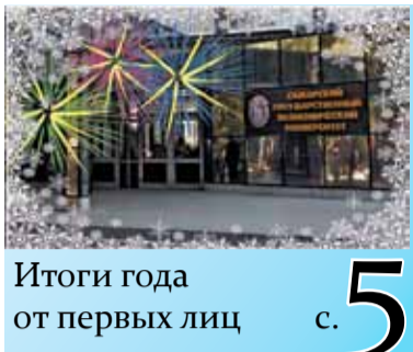
Итоги года от первых лиц с. 5