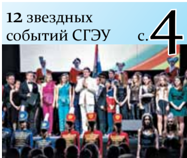
12 звездных событий СГЭУ с. 4