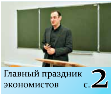
Главный праздник экономистов с. 2