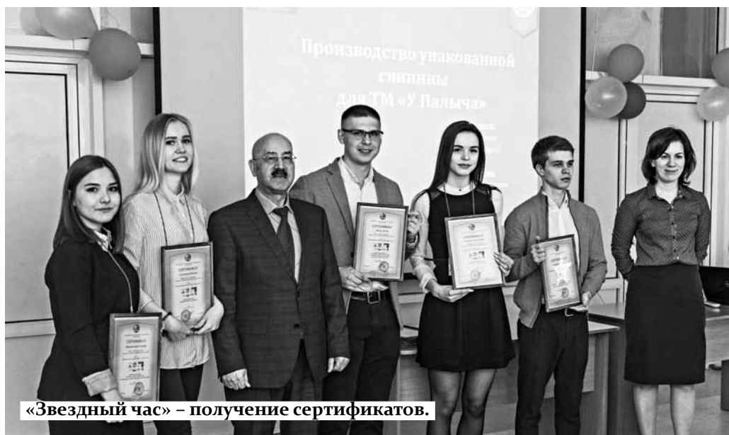
«Звездный час» – получение сертификатов.

для торговых центров, делая упор на мексиканскую кухню и оригинальную подачу.