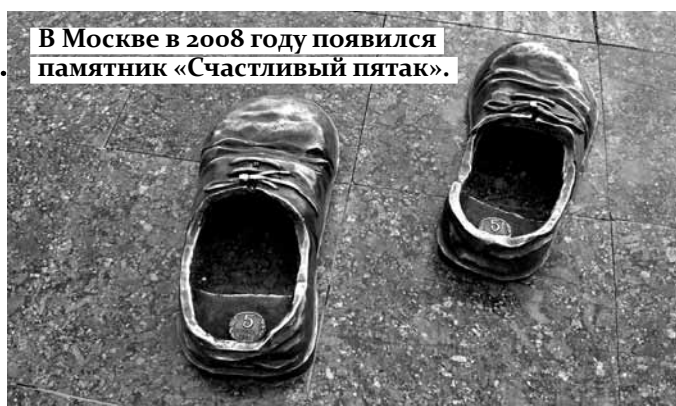
В Москве в 2008 году появился памятник «Счастливый пятак».

я же училась на «мехмате», я знаю. Если хоть чуть-чуть читать лекции и ходить в течение семестра, то потом, когда вы начинаете готовиться даже за три дня до экзамена, что-то всплывает в голове.