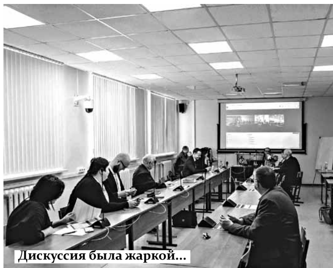
Дискуссия была жаркой...

Все материалы конференции будут размещены в серии книг «Contributions to Economics» (Springer), индексируемых в базе данных Scopus.