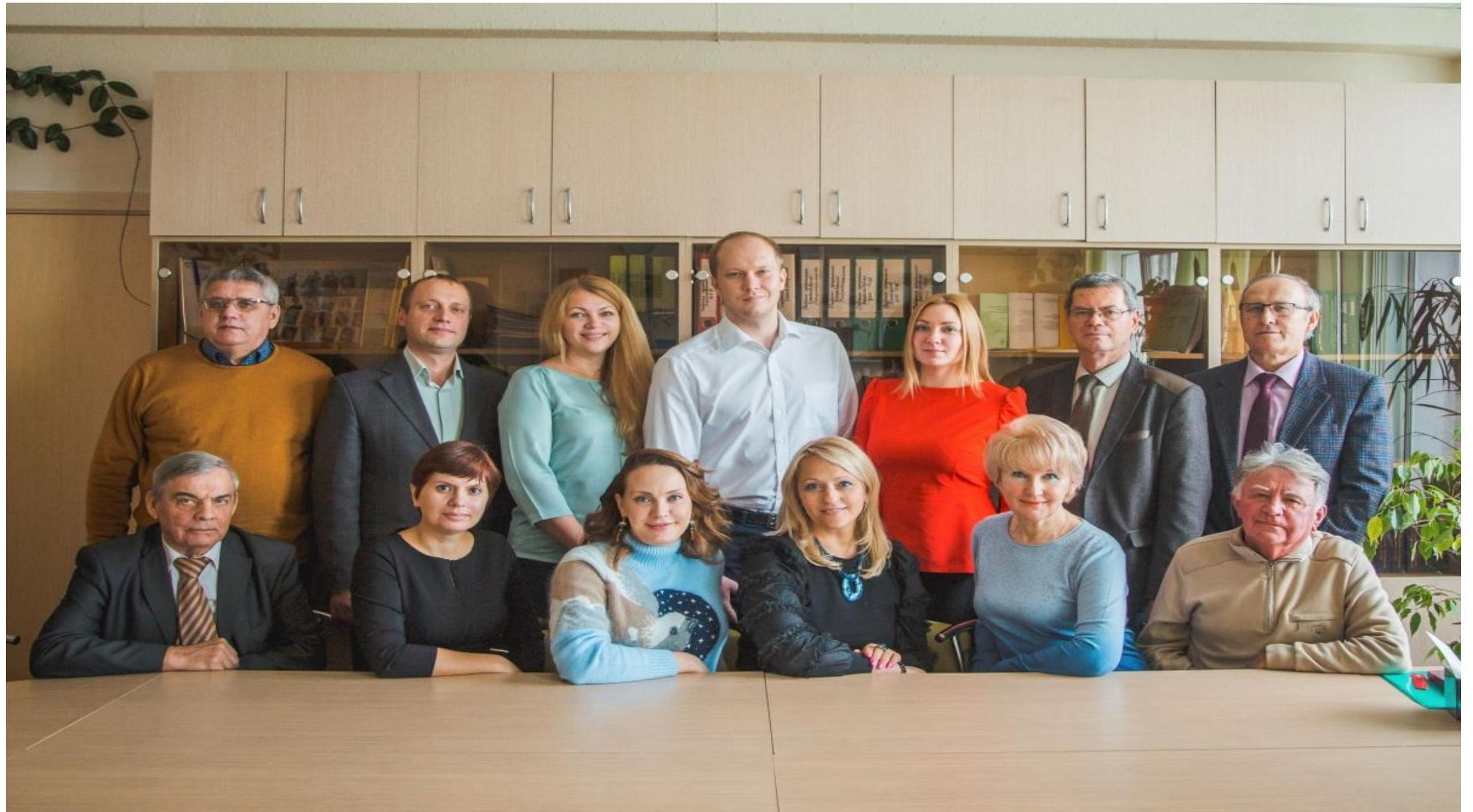
Коллектив кафедры экономической теории. Фото 2013 г.