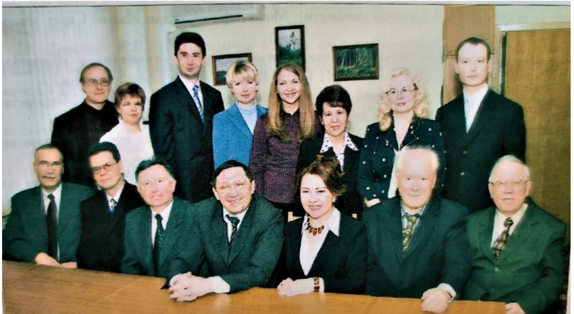
Коллектив кафедры теоретической экономики и международных отношений. Фото 2006 г.