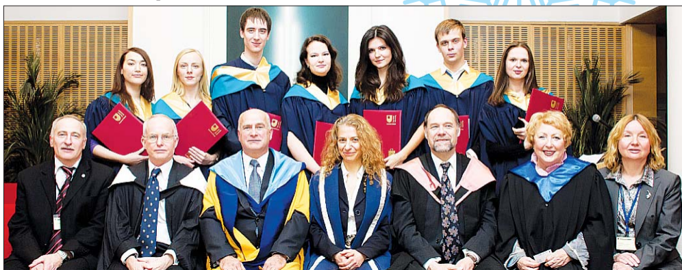
Первые выпускники СГЭУ по программе «Бакалавр бизнес-администрирования» и руководители международного проекта из Великобритании, Москвы и Самары