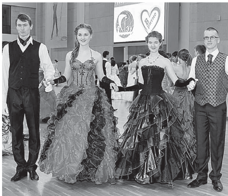
В ходе бала каждый мог представить себя галантным кавалером или прекрасной дамой былой эпохи

С трибун за потрясающим зрелищем наблюдали родите-