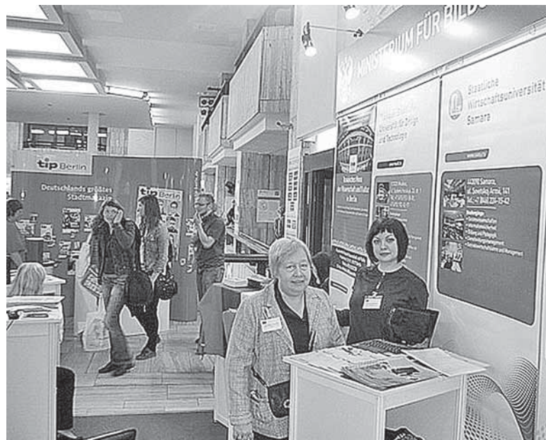
Наши сотрудники презентовали СГЭУ на международном уровне

тетом имени Юстуса Либига в г. Гиссен (Германия), а также возможность виртуального взаимодействия немецких и российских преподавателей и студентов посредством совместных информационно-коммуникационных площадок, созданных на современном инструментари менеджмента знаний.