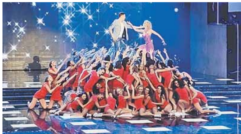
В новом российском шоу танцуют студенты СГЭУ