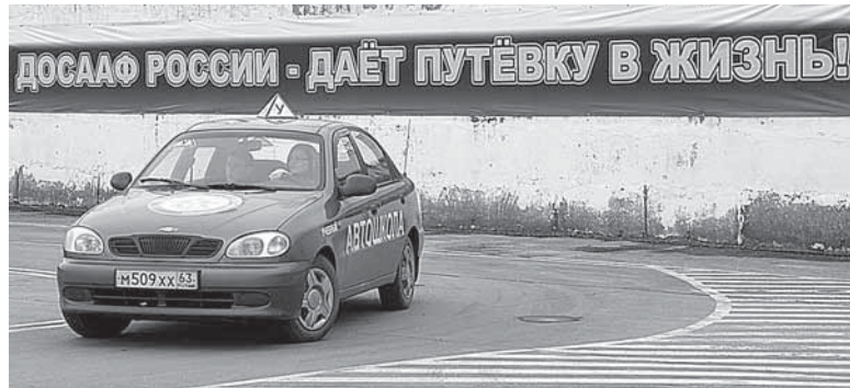
Курсантам дают отличные практические знания