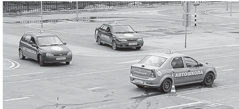
Из любой ситуации выход найдем!