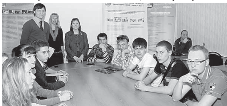
Сплоченная команда СГЭУ показала достойную игру