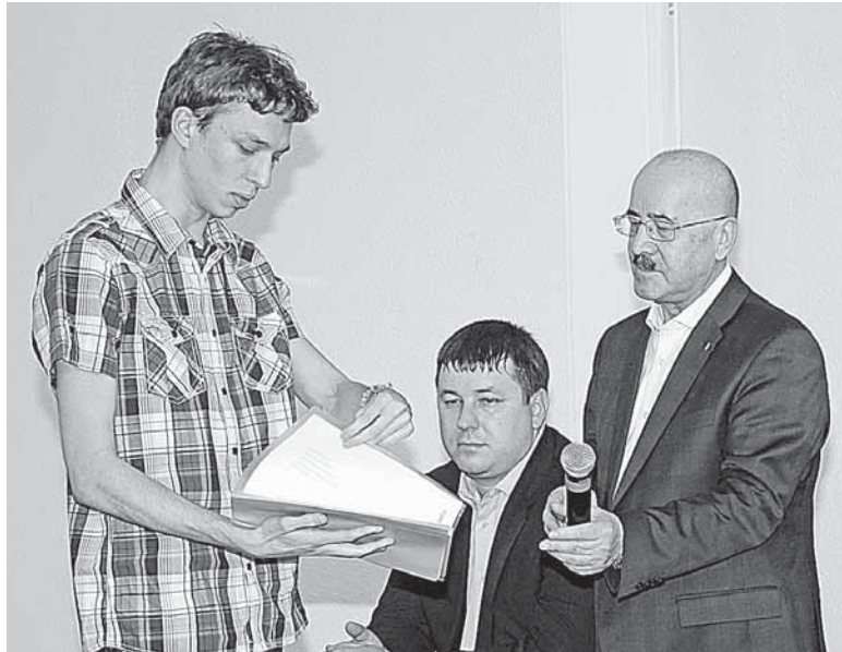
Ректор поддержал инициативу студентов по разработке бренда университета

Ректор в присутствии многочисленной аудитории обещал в ближайшее время устранить все накопившиеся проблемы, в том числе проверить деятельность столовых и буфетов, возможность беспрепятственного доступа к WiFi в зоне