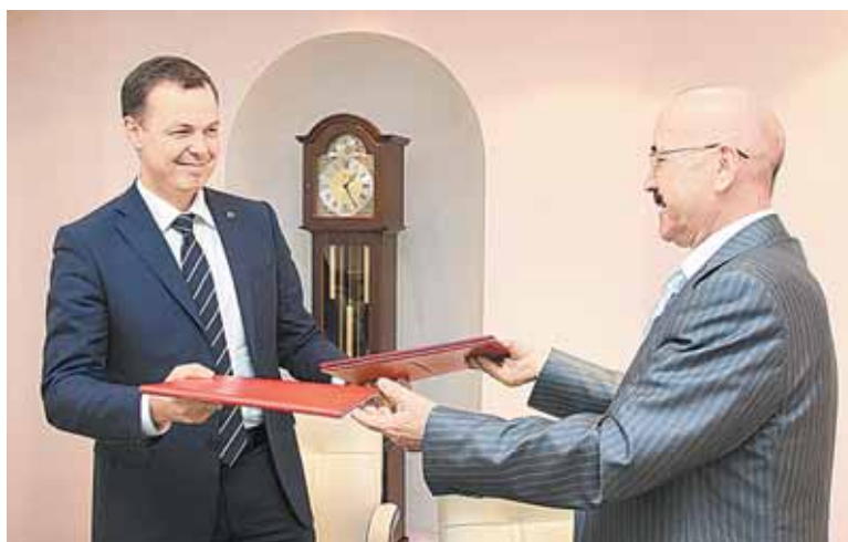
Поволжский банк ОАО «Сбербанк России» и СГЭУ – стратегические партнеры

Сегодня у студентов семи специальностей СГЭУ есть возможность пройти производственную и преддипломную практику в отделениях Сбербанка и принять участие в конкурсе дипломных работ, который проводит Поволжский банк. Кроме того, с декабря 2012 года