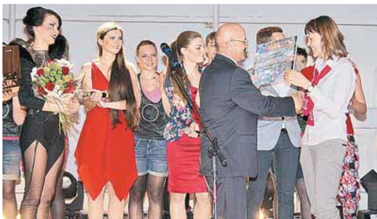
Победителем «Весны» стал Институт систем управления

Помимо ярких эмоций и впечатлений, которые получили как зрители, так и участники Гала-концерта, студенты СГЭУ могут смело гордиться номерами, ставшими дипломантами и лауреатами. Это стало вознаграждением выступающим за бессонные ночи, круглосуточные репетиции, собственноручный пошив костюмов и подаренную радость зрителям. Безусловно,