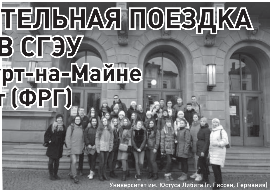
Университет им. Юстуса Либига (г. Гиссен, Германия)

Посещение банка было разделено на две части. Сначала, специально для наших студентов, была проведена лекция, в ходе