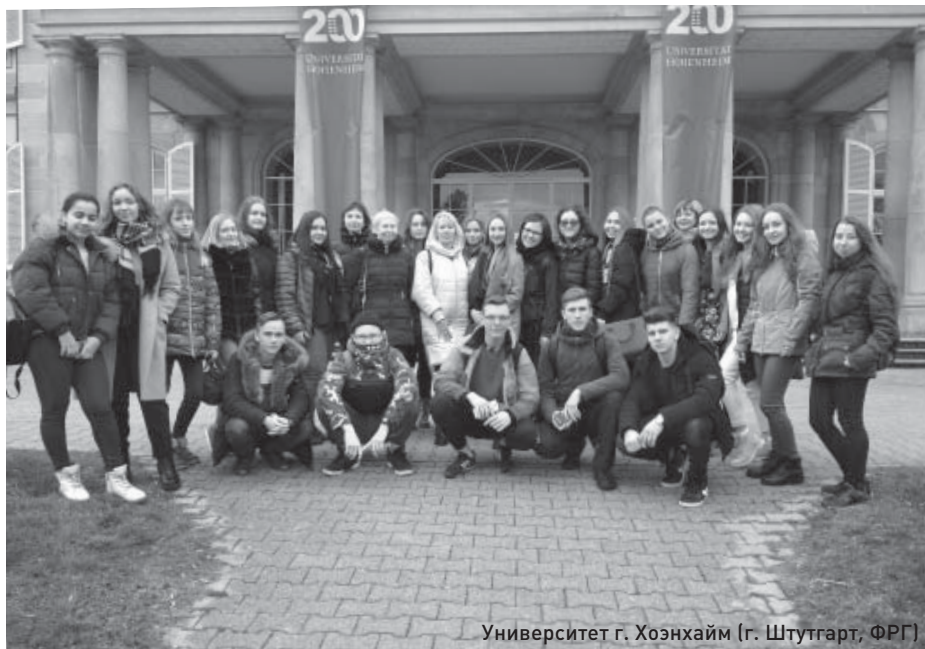
Университет г. Хоэнхайм (г. Штутгарт, ФРГ)