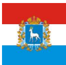
АДМИНИСТРАЦИЯ ГУБЕРНАТОРА САМАРСКОЙ ОБЛАСТИ