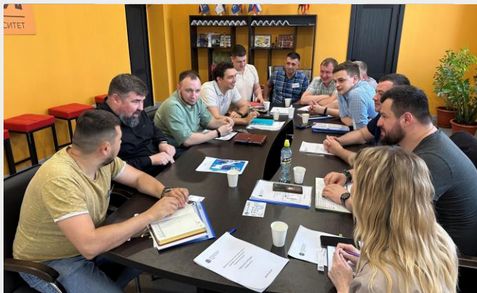
Кампус СГЭУ на ул.Советской Армии