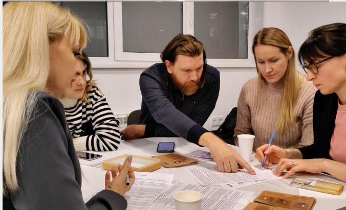
Точка кипения СГЭУ на ул.Галактионовская